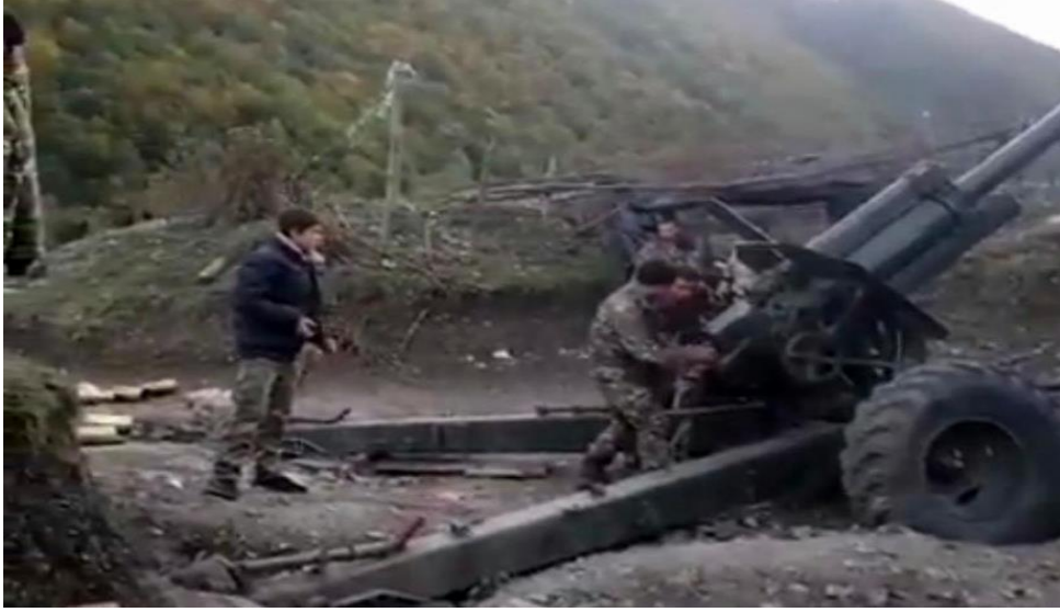
Yeniyyətin hərbi hücumlarda iştirak etdiyi videodan görüntü(1),2020

Sosial media platformalarında paylaşılan video görüntülərdə Ermənistan hərbiçilərinin xüsusən 15 yaşından kiçik bir uşağı Azərbaycan mövqelərinə qarşı aktiv artilleriya atəşinə cəlb etməsi aydın görünür. 6