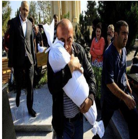
17 oktyabr 2020-ci il tarixində Gəncə şəhərinin 5-ci dəfə atəşə tutulması zamanı həlak olan uşaqlar