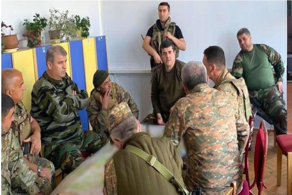
Ermənistan silahlı qüvvələrinin hərbiçiləri uşaq bağçasında görüş keçirirlər.