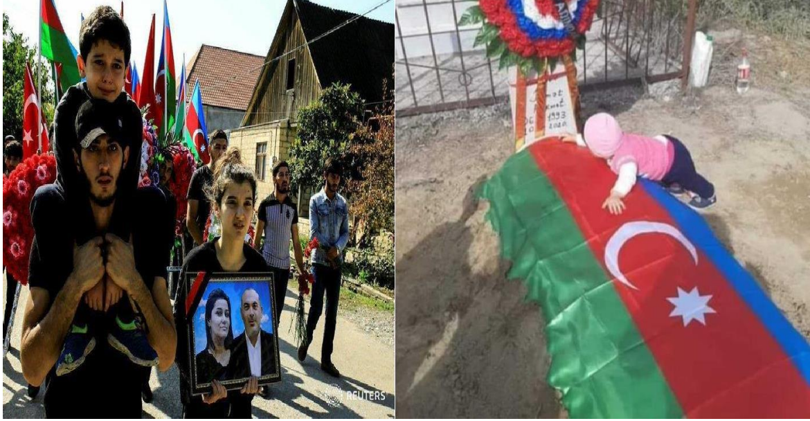
Gəncə şəhərinə edilən raket hücumları nəticəsində hər iki valideynini itirən uşaqlar

Ümumilikdə dörd uşaq hər iki valideynini itirmişdir.